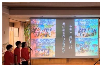
2位 南郷デイサービス門真

毎年賞与前の10月に職員全員参加で行う部署別取組発表。それぞれ部署毎の1年間の取り組みを3分間で発表し、自分達で投票して上位3組には賞金も出していただける南郷の風物詩。コロナ禍では動画発表でしたが、4年ぶりに対面発表を再開。同率で3位が3部署となるほど、全16部署どの部署も良い発表でありました。尚、上位の取り組みはYouTube南郷チャンネルにて公開しておりますので、是非ご確認下さい。