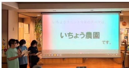
1位 いちようユニット