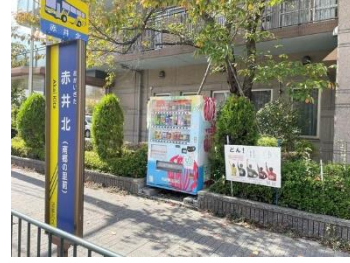
赤井北(南郷の里前)バス停