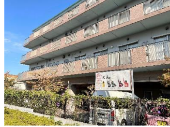
アクロスプラザ側看板

先月号でもご紹介した職員募集。ホームページの更新に続いて、南郷名物『巨大看板』も作成し、掲示させていただいております。過去にも、「看板を見て」と、お電話をいただいた例は数件あり、実際に現在も介護職として働いてくれている仲間もいます。広告の掲載など、求人的一切費用を割かないのは、立地の良さや皆様の口コミによるところが大きいと思っておりますが、その分きちんと職員に還元してくれるのが南郷の一つの良さであり、それが職員の定着にも繋がっていると思っております。これを見ているあなたの周りに、「是非!」という方があれば、ご紹介いただけたらと思います。