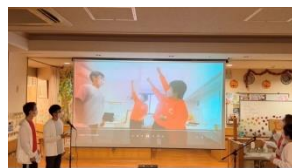
南郷ケアプランセンター門真